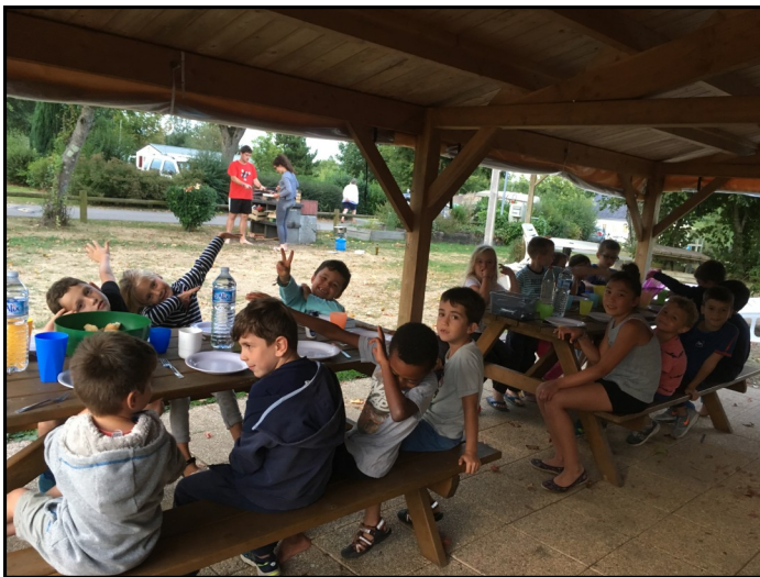
Petit barbecue entre copains !