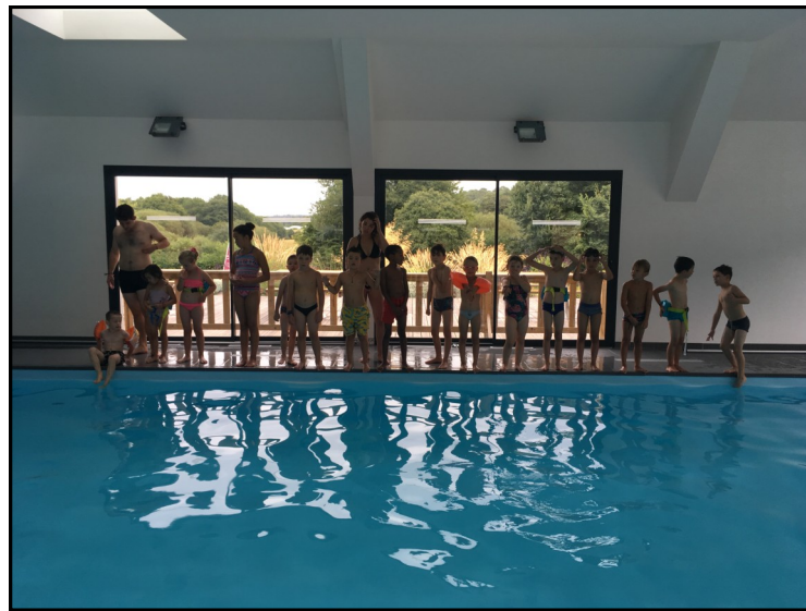
Vive la piscine du camping !

Nos petits campeurs ont pris le bus de ville pour partir à l'aventure sur le camping de Ty Nenez à Pont-Scorff.