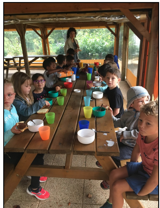
Le petit déjeuner des motivés.