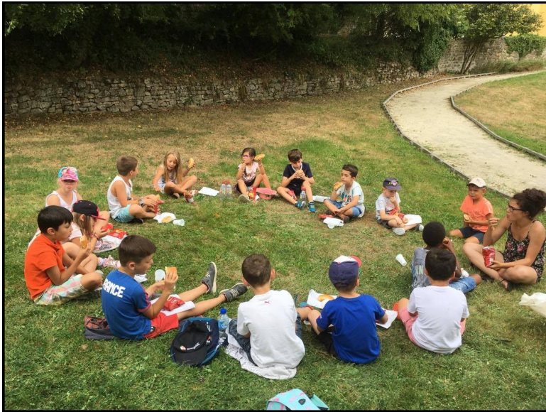
Pique-nique au bord du Scorff.

Entre le pique-nique au bord de la rivière et le fameux barbecue du soir, les enfants ont été enchantés de ces moments entre copains.