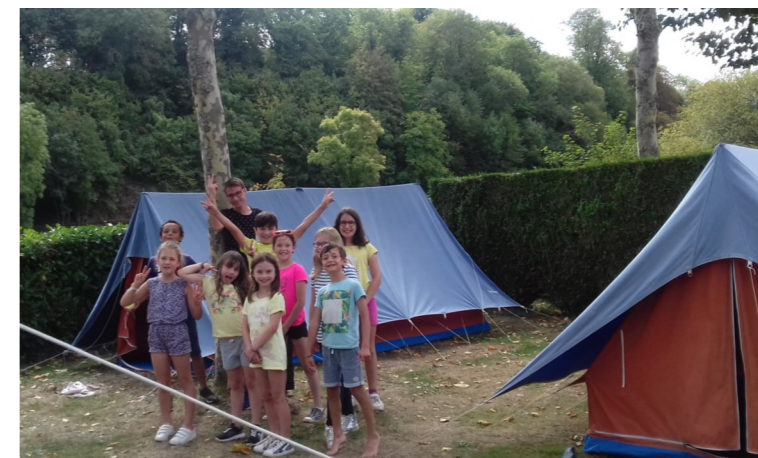
Nos campeurs sur le site de Saint Caradec

Sac sur le dos, nos apprentis campeurs sont partis en bus de ville rejoindre leur campement au camping de Saint Caradec à Hennebont.