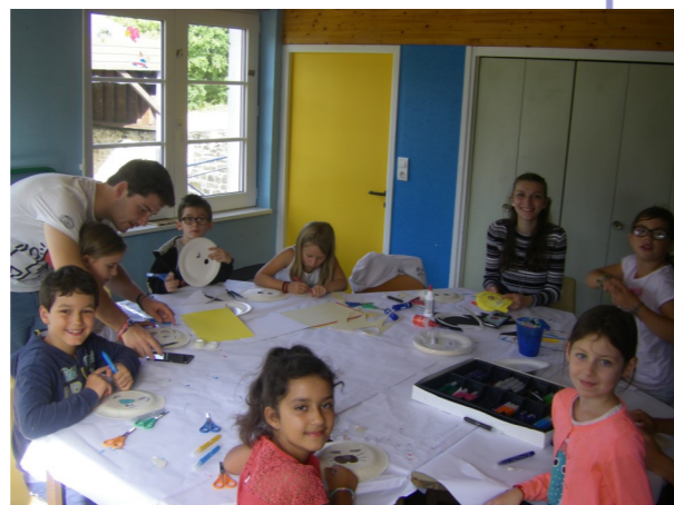
De drôles de personnage ont fait leurs apparition au sein du centre. C'est schtroumpfement bizarre !