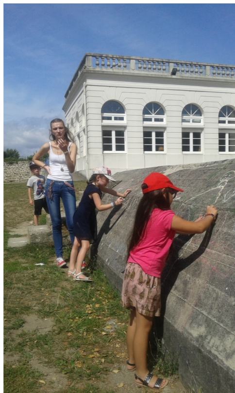
Après s'être essayé au dessin sur papier, ils se sont attaqués au monument historique du centre, afin de le revêtir des couleurs et du thème du mois Schtroumpf.